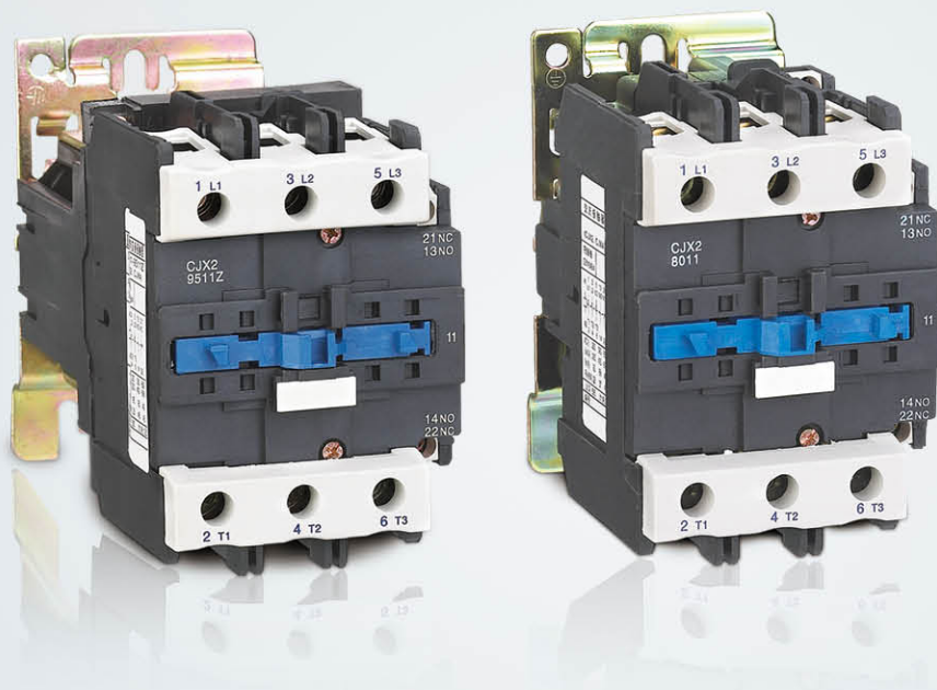
系列交流接触器 Series Ac Contactor CJX2